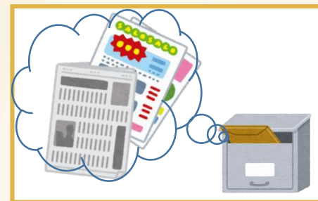
ステップ3:資料を受け取る