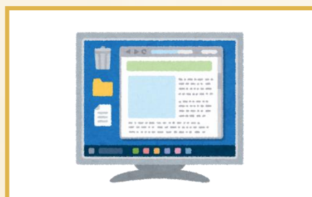
ステップ2:通知を受け取る