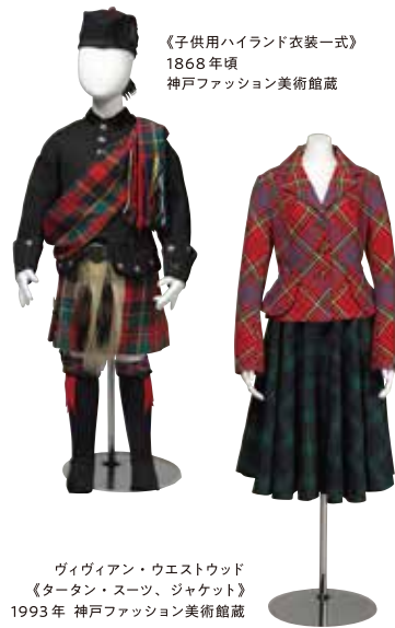
《子供用ハイランド衣装一式》 1868年頃 神戸ファッション美術館蔵

本展では一般にはあまりなじみのない様々なタータン生地約100種によりその多彩で洗練されたデザインをお楽しみいただけます。また19世紀にエディンバラで活躍した風刺画家ジョン・ケイの版画、現在活躍中のファッションデザイナーによる衣装、日本とタータンの関わりを示す資料など総数約270点を通じて、その歴史や社会的、文化的背景をご紹介します。様々な視点からタータンが持つ意味や魅力をさぐります。