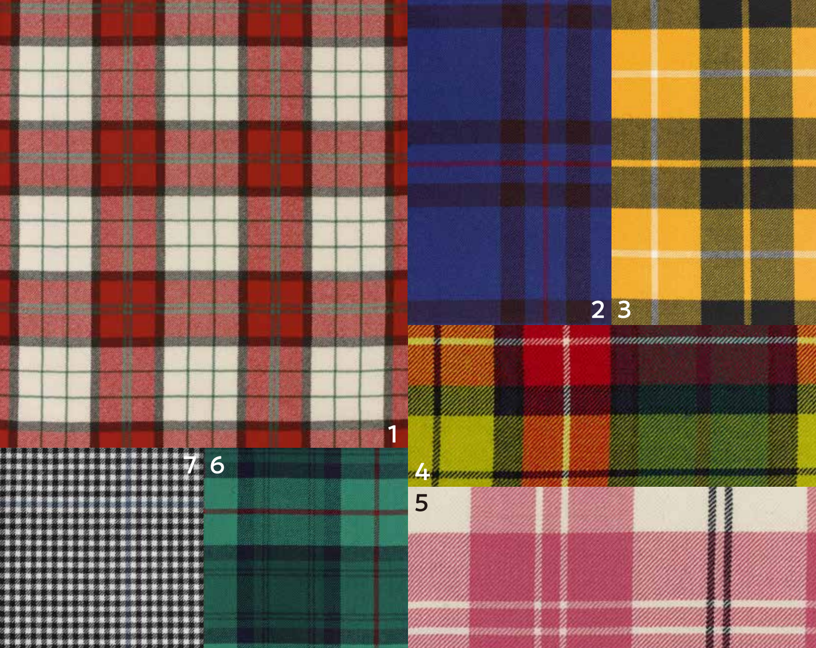
1 ブルドックス・スタータン 2 Elliot(Modern) エリオット (モダン) 3 Barclay Dress(Modern) バークレイ・ドレス (モダン) 4 Buchanan(Modern) ブキヤナン (モダン) 5 Ailsa Pink エルサ・ピンク 6 Cranston(Modern) クランストン (モダン) 7 Buccleuch バクルー